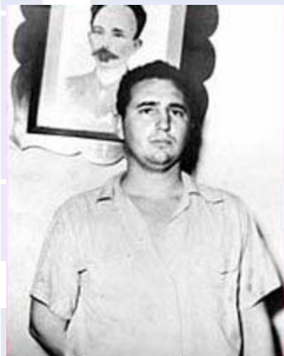
Fidel Castro, en los días del juicio.

Si este juicio, como han dicho, es el más importante que se ha ventilado ante un tribunal desde que se instauró la República, lo que yo diga aquí quizá se pierda en la conjura de silencio que me ha querido imponer la dictadura pero, sobre lo que ustedes hagan, la posteridad volverá muchas veces los ojos. Piensen que ahora están juzgando a un acusado, pero ustedes a su vez serán juzgados no una vez, sino muchas, cuantas veces el presente sea sometido a la crítica demoledora del futuro. Entonces, lo que yo diga aquí se repetirá muchas veces, no porque se haya escuchado de mi boca, sino